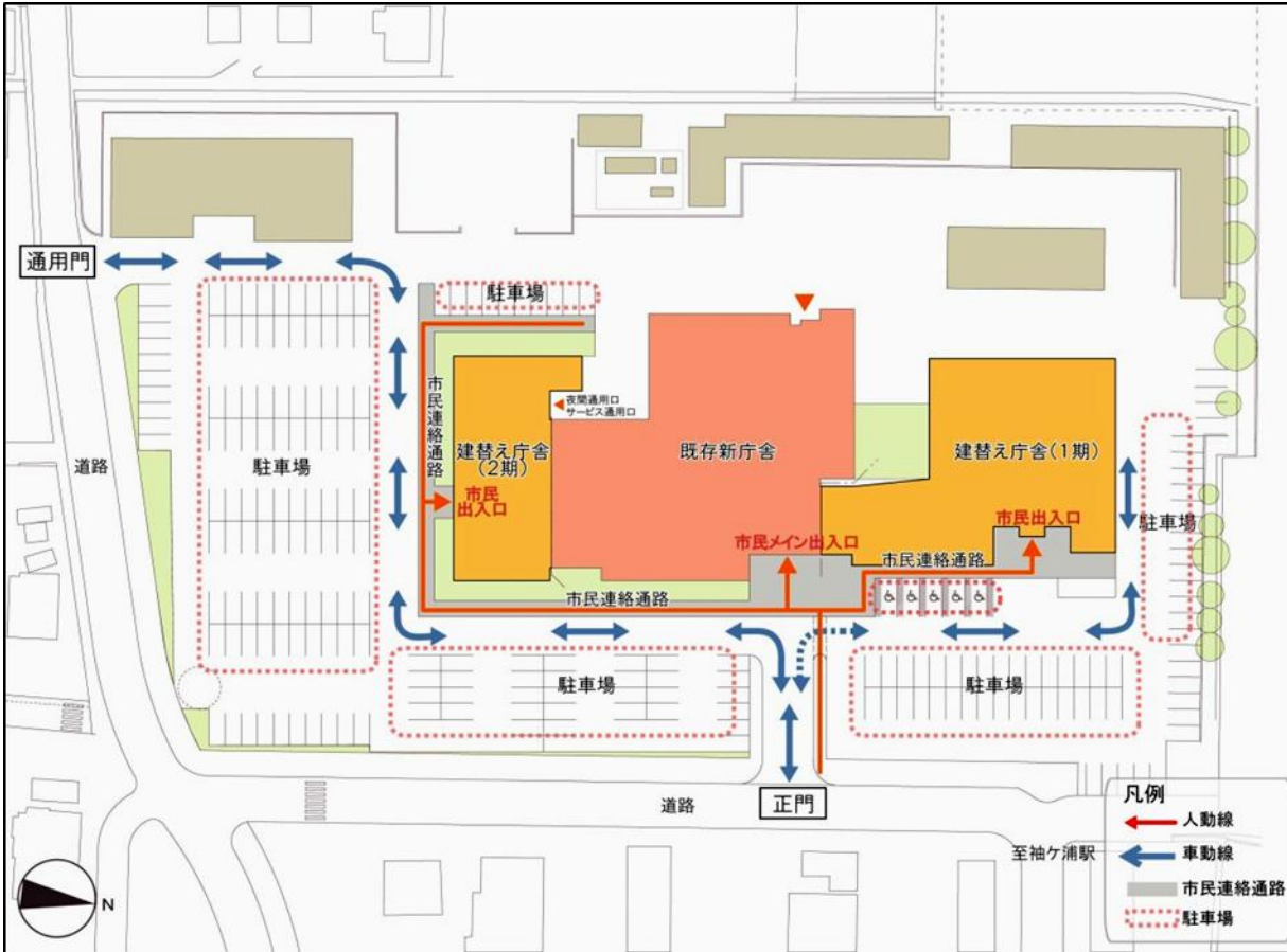
【基本計画での配置計画案】