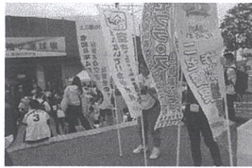
(5/6 プロ野球ファーム・リーグ公式戦)

警察は、SNSで連絡することはありませんし、画像で警察手帳や、逮捕状を送ることはないのです。詐欺を疑いましょう。