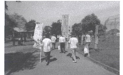
(5/9 百目木公園まつり)