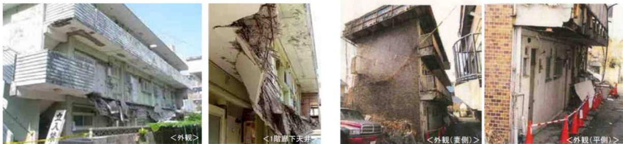
マンションの2階廊下部分が崩落した事例

そのため、管理組合がマンションを適正に管理するとともに、行政はマンションの管理状況、建物・設備の老朽化や区分所有者等の高齢化の状況等を踏まえて、マンション管理の適正化の推進のための施策を講じていく必要があります。