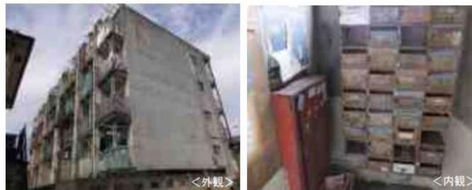
建物の傷みが著しく外壁の剥落、鉄骨の露出などが見られる事例