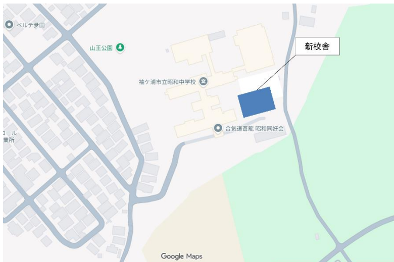
昭和中学校増築校舎 所在地：袖ヶ浦市神納 3204