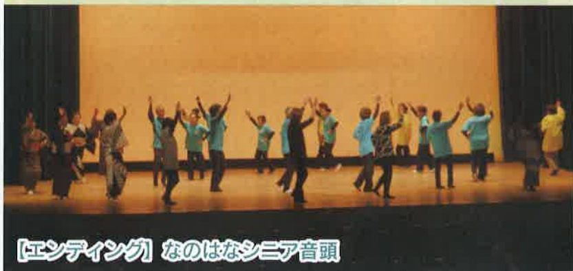
【エンディング】 なのはなシニア音頭