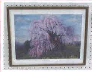
写真 「三春の桜」 (スダレ桜)」 河野きみ代 (福王台福寿会)