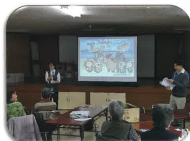
11/6 代宿サロン 代宿支援センターの紙芝居