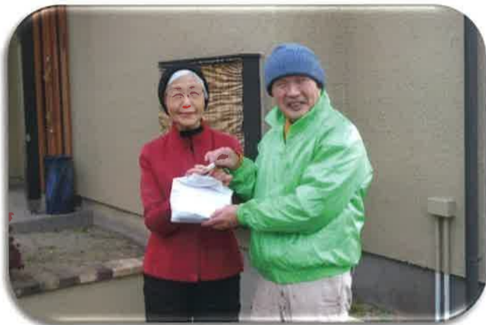
1/21 実際の訪問、手渡し

発行日 令和8年3月31日 発行者 長浦地区社会福祉協議会 広報部会 連絡先 TEL 63-3888 (袖ヶ浦市社会福祉協議会)