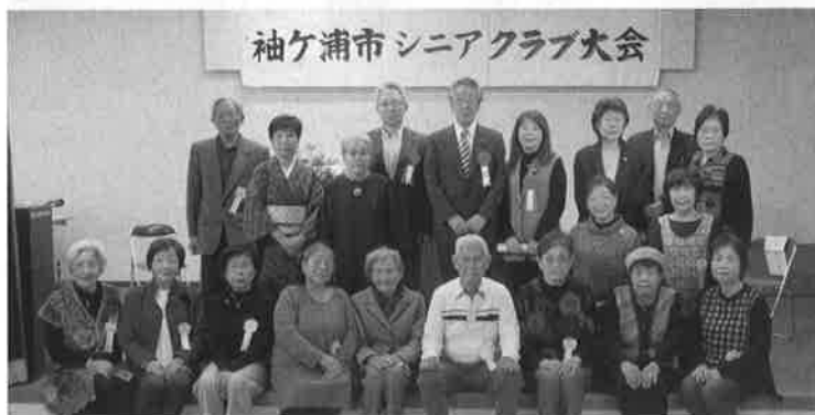
記念撮影で輝く笑顔