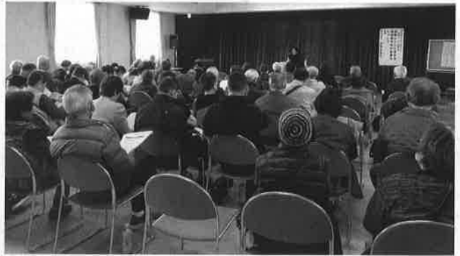
健康寿命 延伸に向けて

高齢者でも、粗食ではなく、1日のタンパク質摂取量60g(基準体重50kg・1.2g×50kg)を目標に、食材の摂取量表を参考に、筋肉をつけるよう、努力してほしいと説明がありました。いつからやるの？「今からでしょー！」を合言葉に、閉会いたしました。