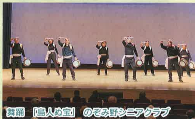
舞踊 「島人ぬ宝」 のぞみ野シニアクラブ