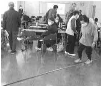
参加者全員が歩幅を計測

①タンパク質を多く含む食材をしっかりと摂取し、筋力を維持・強化し、運動を継続することが大事であること。 ②運動の中でも手軽なウォーキングをおすすめし、1日あたり8000歩(20分)を目標としてほしいが、高齢者は無理せ