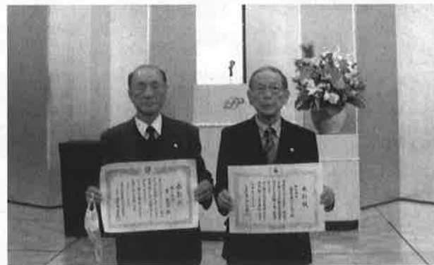
社会福祉へ大きく貢献