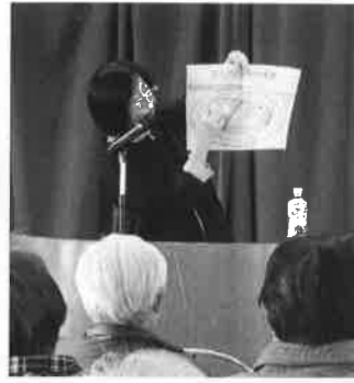
低栄養予防の重要性についてお話

2月12日(木)、袖ヶ浦市民会館3階中ホールにおいて、袖ヶ浦市・木更津市・君津市・富津市のシニアクラブから総勢76名の参加により、管理栄養士安