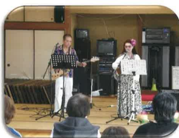
10/23 久保田サロン オテッセウスの演奏と歌