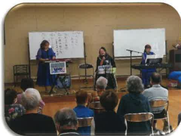
10/14 長浦駅前サロン ひこうき雲の演奏と歌