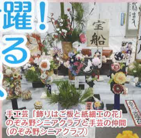
手工芸「飾りはご板と紙細工の花」 のぞみ野シニアクラブと手芸の仲間 (のぞみ野シニアクラブ)

10月21日(火)～27日(月)まで、袖ヶ浦市老人福祉会館において作品展が開催されました。42組が77点の作品を出展し、市内市外から訪れた多くの方を魅了しました。優れた作品には「市長賞」「市議会議長賞」「県老連理事長賞」などが贈られました。