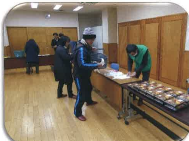
配布迄の準備作業

「物品、資料」をお届けしながら、 見回り先での体調や暮らしぶりを 確認しています。