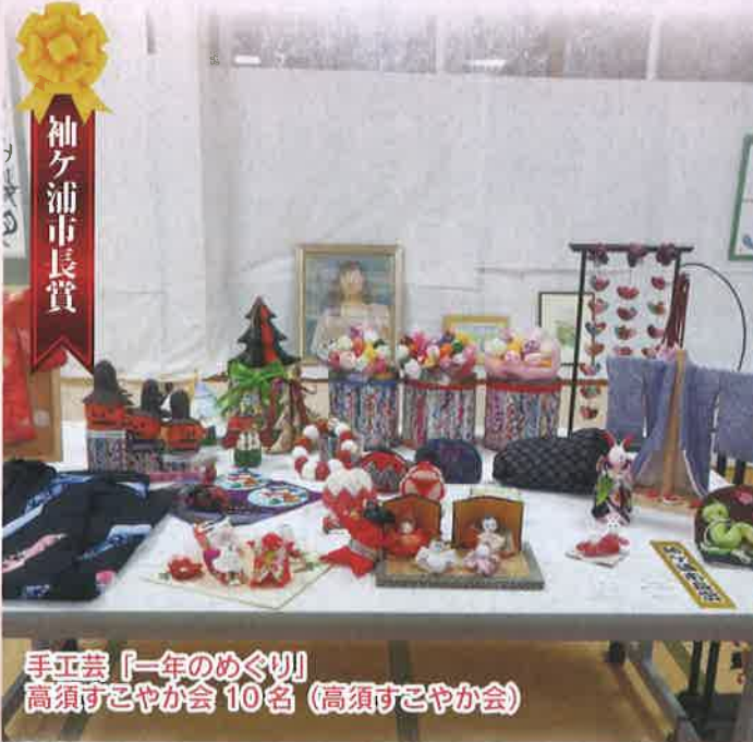
手工芸「一年のめぐり」 高須すこやか会 10名 (高須すこやか会)