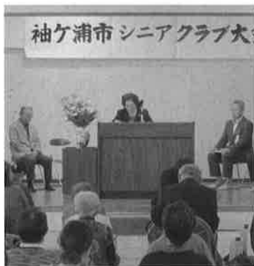
会員や来賓が集い盛会の式典