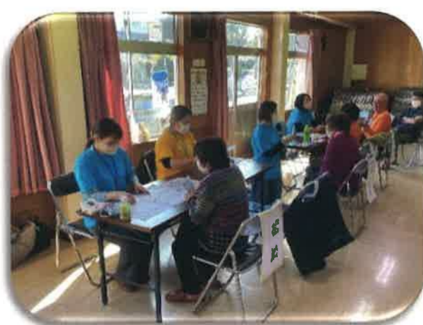
1/10 代宿サロン 「色葉」さんによる健康相談