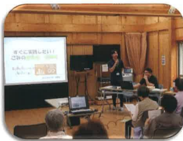
10/1 浜宿団地サロン ゴミの減量化・資源化の話

長浦地区5か所で合計29回(年)開催し ています。予定は逐次チラシ、便り等でお知 らせします