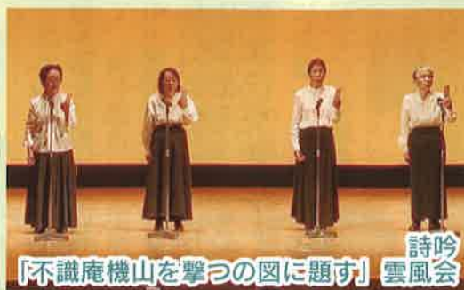
詩吟 「不識庵機山を撃つ図に題す」 雲風会