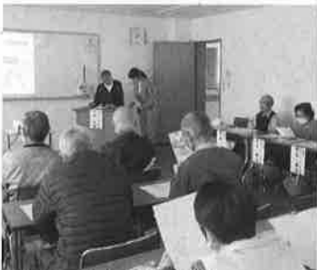
正しい歩行姿勢を学びました

ず5000歩を目指してほしい。正しい歩行姿勢を身に着け、健康寿命を延ばし、健康で長生きできる体づくりをしていただきたいと熱心な説明を受けました。