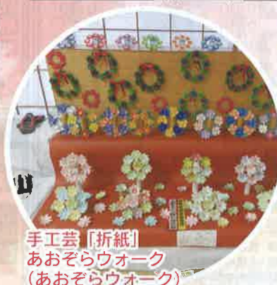
手工芸「折紙」 あおぞらウオーク (あおぞらウオーク)