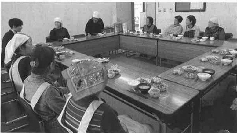
みんな揃って試食会へ