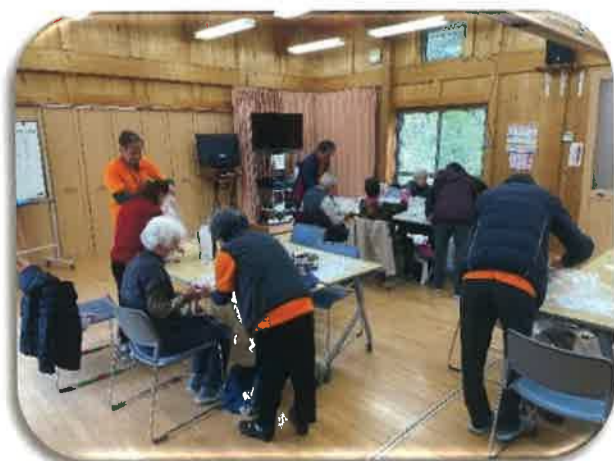
12/13 浜宿団地サロン 防災グッズ作り