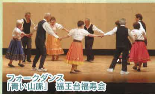
フォークダンス 「青い山脈」 福王台福寿会