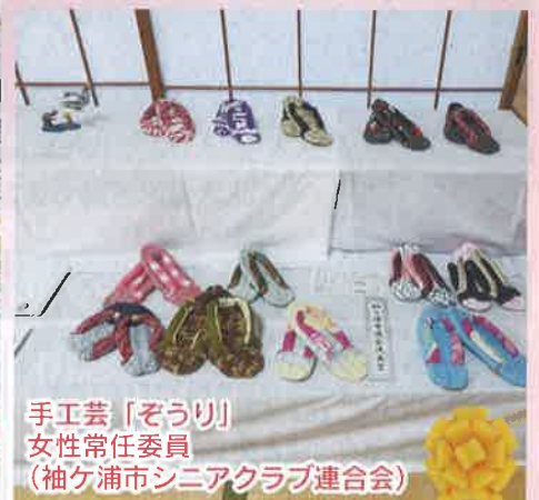
手工芸「ぞうり」 女性常任委員 (袖ヶ浦市シニアクラブ連合会)