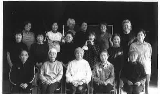
居心地のいい集い場に