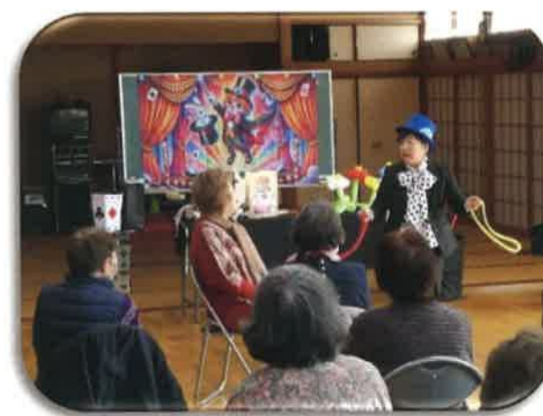
2/12 久保田サロン 手品