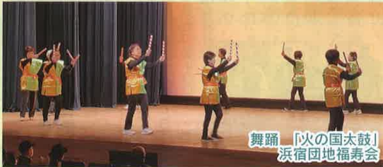
舞踊 「火の国太鼓」 浜宿団地福寿会