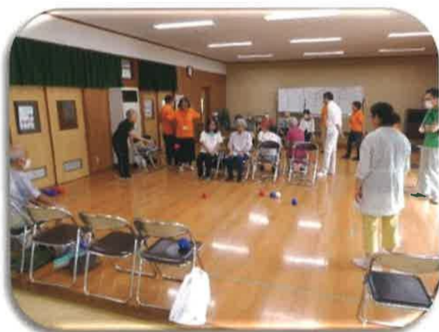
9/16 長浦駅前サロン ポッチャ