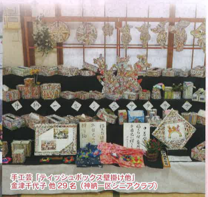
手工芸「ティッシュボックス壁掛け他」 金津千代子 他29名 (神納一区シニアクラブ)