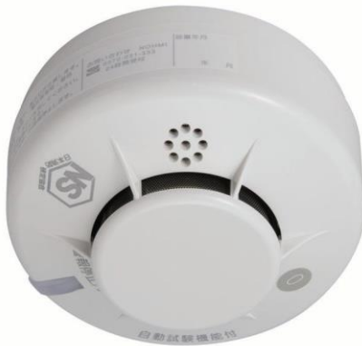
住宅用火災警報器（機種により形状が異なります。）