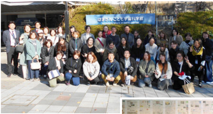
◀はまぎん こども宇宙科学館

業界の現況や記事の書き方、取材で見た著名人の裏話などの話を伺いました。講師の話がとても上手で内容も興味深く、参加者は昼食後の眠気も忘れて耳を傾けていました。最後は時間が押してしまい、常設展示の見学が駆け足になってしまいましたが、報道の役割を考える貴重な機会になりました。新聞を作ったり宇宙に行ったりおいしい昼食を囲んだり、一人では難しいこともみんなで集まればきっとできる。正しく今年度の市P連のテーマである「～人の輪、交流の輪、情報の輪～」の重要性を感じる一日でした。