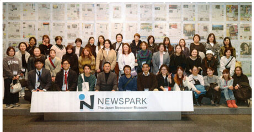
ニュースパーク▶ (日本新聞博物館)