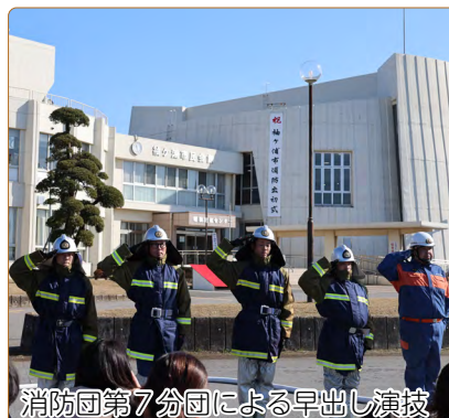
消防団第7分団による早出し演技