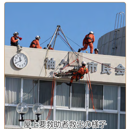
屋上要救助者救出の様子