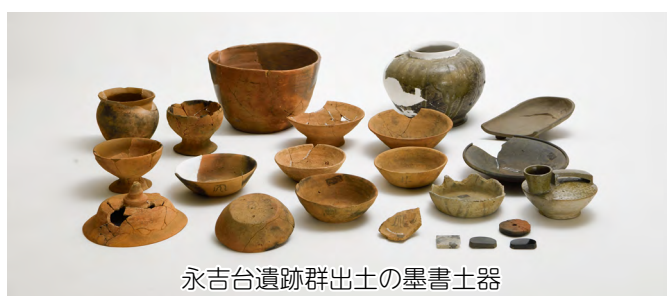
永吉台遺跡群出土の墨書土器