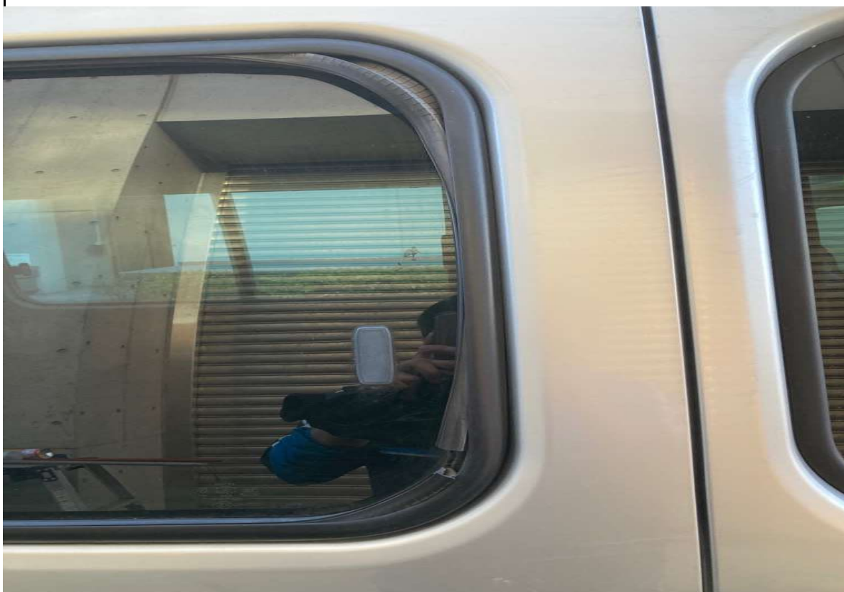
後部スライドドア (ゴムパッキン劣化による破損)