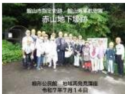
館山海軍航空隊赤山地下壕跡見学

第1回は、6月19日（木）「村のくらしと一大事 ～江戸時代の事件記録を読む～」と題し、袖ヶ浦市内で発生した江戸時代の刑事事件に関係した古文書を読み解きました。第2回は、7月14日（月）館山海軍航空隊赤山地下壕跡を見学しました。第3回は、9月11日（木）「郷土博物館バックヤード探検ツアー」と題し、郷土博物館のいろいろな倉庫に保管されている貴重なお宝（遺品や書物、美術品、工具、農機具、剥製など）を見学しました。第4回は、大多喜城下に点在する貴重な史跡や文化・歴史遺産を大多喜町城下町案内人の会の方に丁寧に案内していただき、古き街並みを散策しました。第5回は、11月17日（月）日本製鉄（株）東日本製鉄所君津地区の工場見学をしました。第6回は袖ヶ浦市椎の森工業団地のサニークリーン工場見学を、第7回は「戦後80年を考えよう」と題する講話を予定しています。興味関心のある方は、根形交流センターまでお問い合わせ下さい。