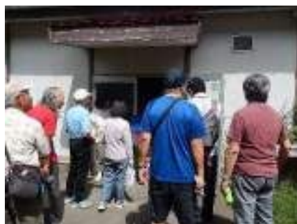
郷土博物館バックヤード探検ツアー