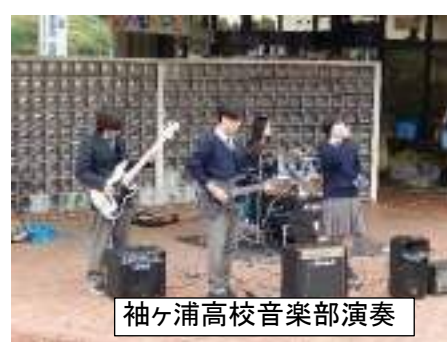
袖ヶ浦高校音楽部演奏