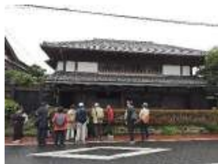
大多喜城下町見学