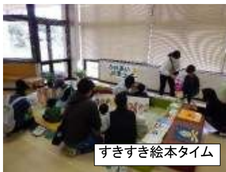
すきすき絵本タイム