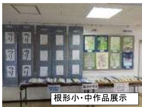
根形小・中作品展示