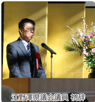
江野澤県議会議員 祝辞