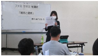
講師：明治安田生命 千葉南支社 社員