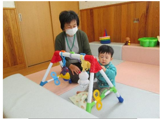
預かり援助の様子