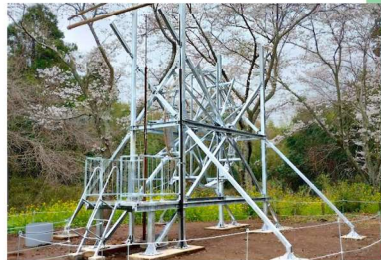
内房総アートフェス作品 『未来井戸』