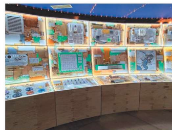
内房総アートフェス作品 『SKY EXCAVATER』