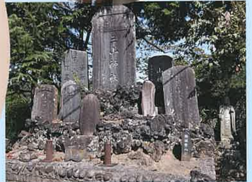
出羽三山供養塚(浜宿)