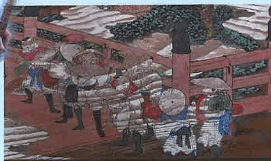
絵馬「三山登拝記念祓川橋之図」部分(蔵波八幡神社所蔵)