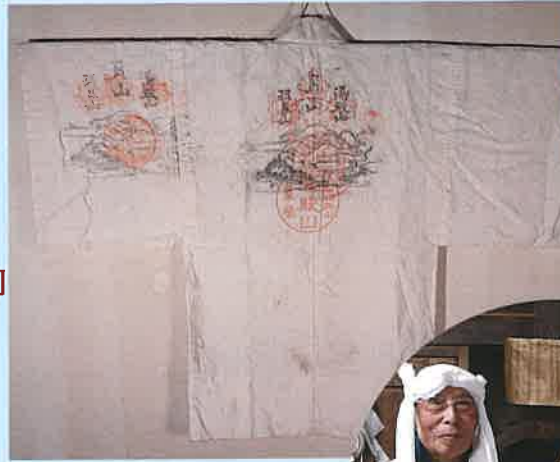
出羽三山行人の行衣 (当館蔵、下新田八日講寄贈)