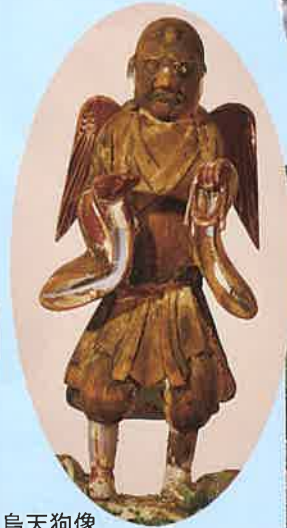
烏天狗像 (当館蔵、下久保田八日講寄贈)