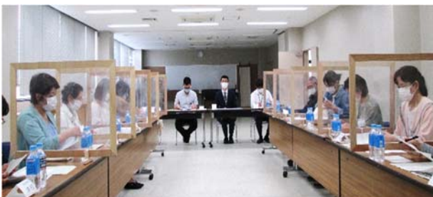
皆さん真剣に話を聞いています。

令和元年10月よりファミサポが幼児教育無償化の対象事業になったため、安全性の確保のために「事故防止に関する講習」が義務づけられました。袖ヶ浦市ファミサポでは毎年1回開催します。