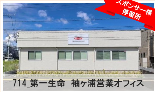
714_第一生命 袖ヶ浦営業オフィス