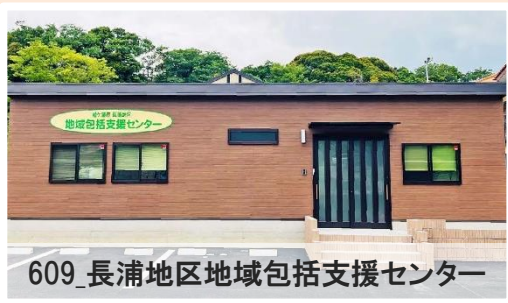
609_長浦地区地域包括支援センター