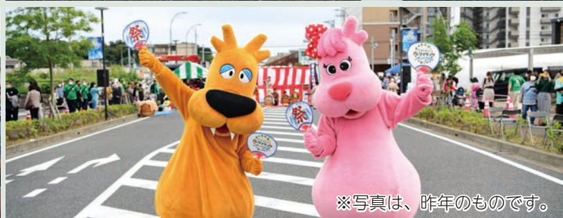
※写真は、昨年のものです。