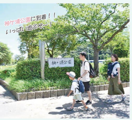
袖ヶ浦公園に到着！！ いっぱい遊ぼう～！