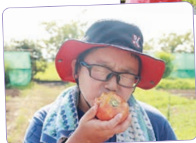
野菜やフルーツ の収穫体験！採れた たては美味しい!!