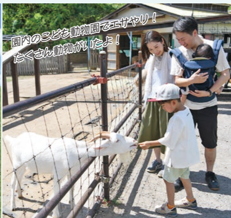
国内の子ども動物園でエサやり！ たくさん動物がいたよ！