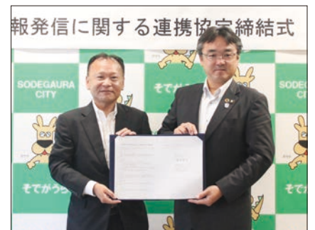
報発信に関する連携協定締結式

この協定により、デジタル化が進展する社会で、情報発信について協働での活動を推進し、地域が継続して発展できる機会の創出を図っていきます。