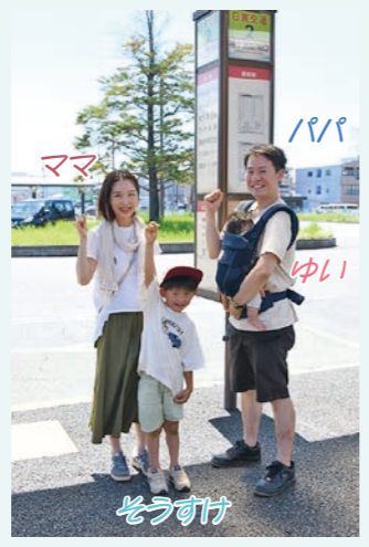
袖ヶ浦駅 南口から出発！