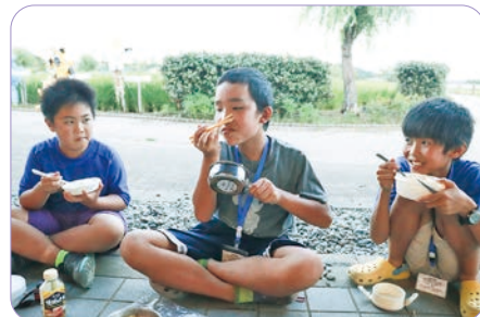
献立を考え、買い出しをして、料理を作る ところまで、全て自分たちでやります。