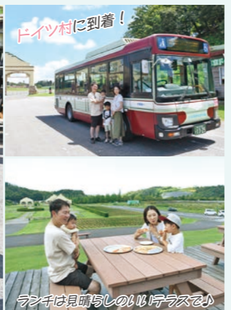
ドイツ村に到着！ ランチは見晴らしのいいテラスで

路線バスで通勤しています 私は、長浦駅 南口から出ている「代宿団地袖ヶ浦バスターミナル線」を利用して、通勤しています。 平成23年に、椎の森工業団地にサニクリーン東京の千葉工場ができた時に、都内の営業所から希望して異動となり、その時からこの工場に働いています。 当時は、路線バスが椎の森工業団地内まで通っていなかったため、自宅がある都内から車で通勤していました。朝は約1時間で来ることもできるのですが、夕方は帰宅ラッシュにぶつかると、2時間以上かかってしまい、仕事の疲れもあつたので、とても大変でした。 平成27年に「代宿団地袖ヶ浦バスターミナル線」が椎の森工業団地まで延伸されたからは、電車とバスでの通勤に変えたので、行き帰りの通勤が楽になり、とてもよかったですね。仕事で疲れた帰宅時も、寝ながら帰ることができ、自分で運転しなくていいので安心です。 また、車通勤の時には通る機会がなかった、長浦駅前通りの道をバスで通った時には、窓から見える景色で「こんなところがあるん