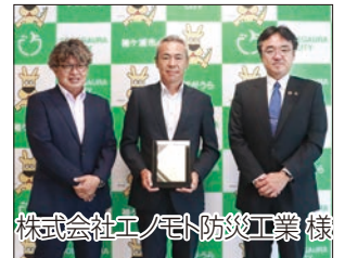
株式会社エノモト防災工業 様