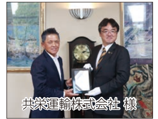
共栄運輸株式会社 様

企業版ふるさと納税として、1,000万円の寄附をいただき、共栄運輸株式会社で表彰式を行いました。