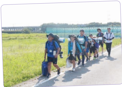
移動は歩きが原則の 1日に10km以上歩いた班も...!