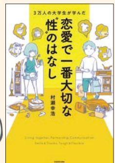
3万人の大学生が学んだ恋愛で一番大切な「性」のはなし 村瀬 幸浩 著 KADOKAWA

人気の小説が多数！ 字も大きめで読みやすい！ 借りにくい内容の本も、電子図書館なら大丈夫！