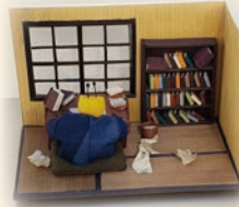
ボランティアが制作した「文豪トショロ」

ボランティア3人でお手伝いをしています。展示テーマに沿った展示物を、各自の得意分野を活かして作り、展示に華を添えています。