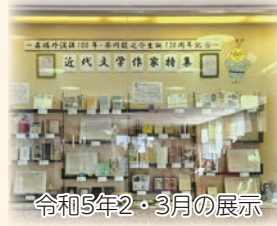
令和5年2・3月の展示