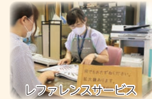
レファレンスサービス