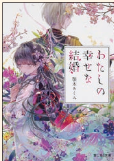
わたしの幸せな結婚 一～六 顎木 あくみ 著 KADOKAWA