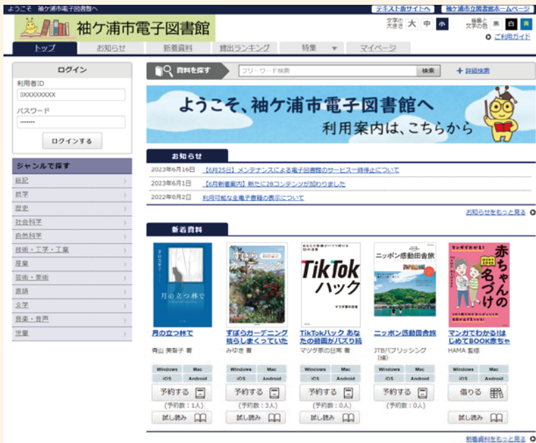
▲電子図書館トップページ

初回ログイン時のID・パスワードのご案内 利用者ID: 図書館資料利用券に記載の9桁の数字 パスワード: 図書館に登録した住所の郵便番号7桁