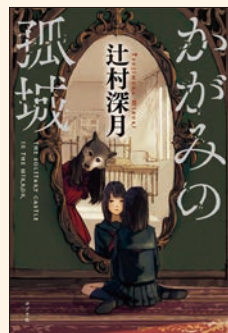
かがみの孤城 辻村 深月 著 ポプラ社

人気の小説が多数！ 字も大きめで読みやすい！ 借りにくい内容の本も、電子図書館なら大丈夫！