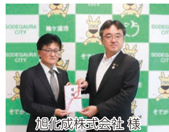
旭化成株式会社 様