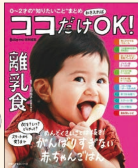
ココだけおさえればOK! 離乳食 主婦の友社

赤ちゃん連れて図書館へ行くのが難しい時に！ スマートフォンで見られるのでお出かけもラクラク♪