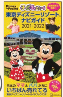
子どもといく 東京ディズニーリゾート ナビガイド2021-2022 講談社

赤ちゃん連れて図書館へ行くのが難しい時に！ スマートフォンで見られるのでお出かけもラクラク♪