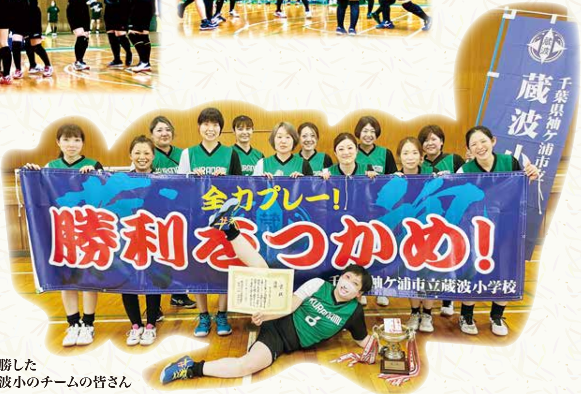
優勝した 蔵波小のチームの皆さん

昨年に引き続き、優勝できてとても嬉しいです。次は10月の4市で勝ち、11月の県大会で優勝できるように頑張ります。応援よろしくお願いします。