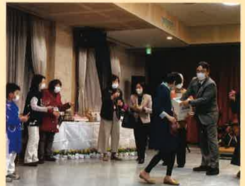
お楽しみの抽選会 幸運は誰かな？

初めて参加の方、久しぶりにイベント参加の会員の方また、近隣の国際交流協会の皆様と楽しい時間が持てました。