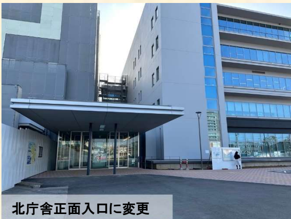
北庁舎正面入口に変更