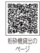
粉碎機貸出のページ

植木などを剪定した際に発生する切枝は、粉碎してチップ化することで、たい肥の基材や植木などに利用できます。ごみの減量化・資源化のため、ぜひご利用ください。 注意事項 枯木の処理はできません。生木のうちに処理してください。 処理できる枝の太さは、20～35mmです(樹木の種類で異なります)。 無理な操作などが原因で故障した場合、修理費用などは借りた方の負担となります。 健康推進課 ☎(63)1881 FAX(62)2820