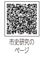
市史研究のページ

原稿提出期限 10月6日(金) 郷土博物館 ☎(63)0811 FAX(63)3693 sode65@city.sodegaura.chiba.jp