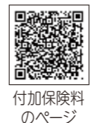
付加保険料のページ

加入手続き 保険年金課、または長浦・平川行政センターで、年金手帳(基礎年金番号通知書)と顔写真付きの証明書を持参して申し込んでください。 健康推進課 ☎(62)3092 FAX(62)1934 木更津年金事務所 ☎(23)7616