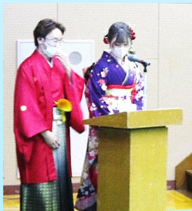
司会・進行 写真左