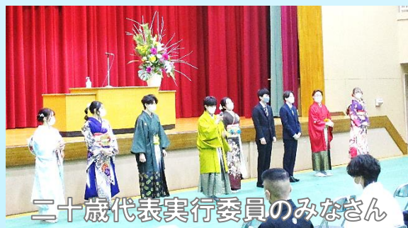
二十歳代表実行委員のみなさん