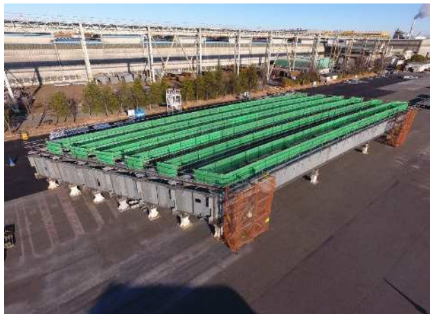
⑨仮組立完了・検査