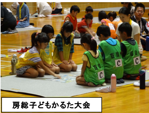
房総子どもかるた大会