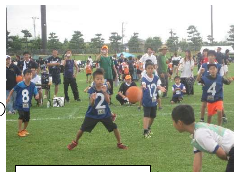
子どもスポーツ大会