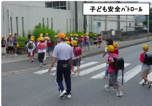
子ども安全パトロール