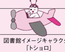
図書館イメージキャラクター「トショロ」