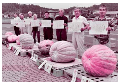
農林振興課 ☎(62)3460 FAX(62)7485

市内で生産された「アトランティック・ジャイアントカボチャ」の重さを競う、ドデカ・カボチャ大相撲大会を開催します。重量部門のほかに「美人カボチャ部門」や「面白カボチャ部門」なども行います。 日時 9月19日(土)午前10時〜 場所 農畜産物直売所「ゆりの里」