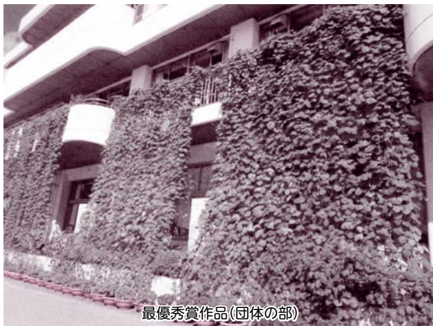
最優秀賞作品(団体の部)