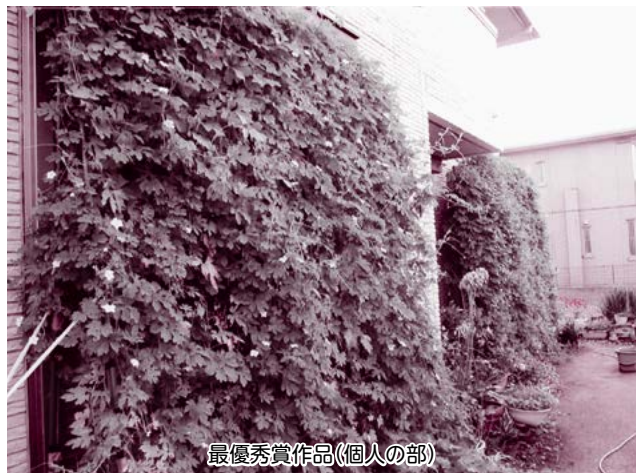
最優秀賞作品(個人の部)