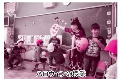
ハロウィンの授業