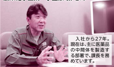
入社から27年。現在は、主に医薬品の中間体を製造する部署で、課長を務めています。