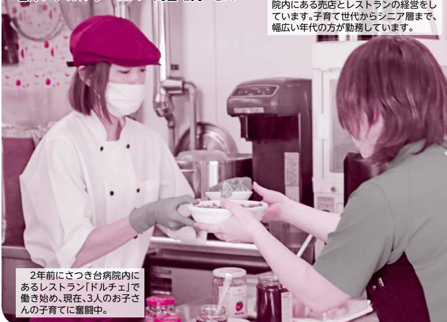
2年前にさつき病院内にあるレストラン「ドルチェ」で働き始め、現在、3人のお子さんの子育てに奮闘中。

君津メデカルサービスは、さつき病院内にある売店とレストランの経営をしています。子育て世代からシニア層まで、幅広い年代の方が勤務しています。