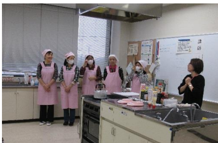
食生活推進員の皆さん