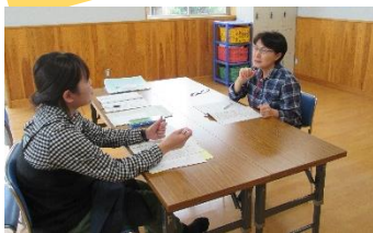
基礎研修会の様子

日時：① 1月30日(火) ② 3月10日(土) 午前の部 10時30分～12時 午後の部 1時30分～3時