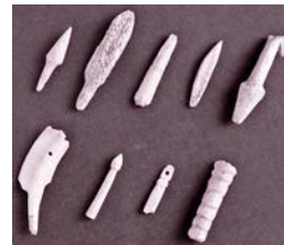
山野貝塚の骨角歯製品

郷土博物館で国史跡「山野貝塚」の展示を見学した後、散策コースを歩き、現地で解説します。