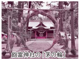
飽富神社の「茅の輪」

市内では、飽富神社・国勝神社の夏越の大祓の記載がありますが、茅の輪くぐりを飽富神社で行うようになったのは、ごく最近のことのようです。茅の輪のくぐり方ですが、まず一礼し、右足から輪をまたいでくぐり、左に回り元の位置に戻ります。正面に戻ったらまた一礼し、右足から輪をまたいで、次は右側に回ります。ちょうど上から見ると8の数字を寝かせたようなくぐり方になり、また、神社によって少しずつくぐり方が違います。1年の締めくくり、身を清め、清々しい気持ちで新しい年を迎えてみませんか？