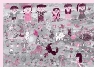
ポスター原画コンテスト優秀賞の作品

子どもの人権ポスター原画コンテストには市内小・中学校から、中学生人権作文コンテストには市内中学校から、多数の参加がありました。