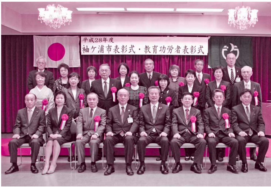
平成28年度 袖ヶ浦市表彰式・教育功労者表彰式

市では毎年、市政の発展や公共の福祉の増進などに功労のあった方、または善行が優れ、市民の模範となる方を、市の表彰規則に基づき表彰しています。