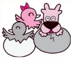
袖ヶ浦市マスコットキャラクター「ガウラ」

今回は、来年の干支「酉」と一緒に卵から顔を出す「ガウラ」のかわいいイラストなどです。