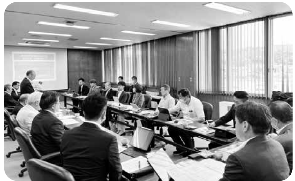
久慈市での視察の様子

久慈市は、平成23年に「東日本大震災」、平成28年に「台風10号」、令和元年に「台風19号」など大きな災害を経験しています。幾多の災害を経験し、久慈市議会では、災害時の議会・議員の対応を明確にした議会災害時対応マニュアルを平成25年10月に策定しました。この対応マニュアルに基づき、平成28年の「台風10号」、令和元年の「台風19号」発生直後から、市議会災害対策連絡会を設置し、議員全員が災害現場に出向き、直接住民の声を聞き、取りまとめるなど議会の特性を活用し、市長部局とは異なる支援体制を確立しました。また、新型コロナウイルス感染症への対応を踏まえ、議会BCPへと災害対応を進化させています。この市民に寄り添った議会の災害対応は、先進的取組として全国的に注目を集めています。「災害発生時に議会や議員はどのように動けばよいのか」という課題について、先進的議会の対応を視察することで袖ヶ浦市議会でも災害時の対応を整理し、災害発生時の体制整備に着手しました。