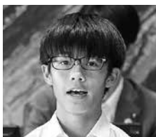
平川中学校 3年生 いまに けいたろう 今西 啓太郎 議員

これからの袖ケ浦は、障がいも含めた人それぞれの個性を認めあい、誰もが当たり前で平等で支えあいながら暮らしていけるまちにしていきたいです。そうすれば、袖ケ浦は誰もが住みやすく幸せに暮らせるまちになっていくと思います。誰にでも優しい袖ケ浦。さまざまな人が分け隔てなく笑顔で暮らせる共生社会が実現されるふるさどであって欲しいと願っています。