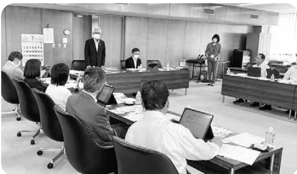
天童市での視察の様子

天童市は、人口・面積とも袖ヶ浦市と同じ規模の自治体。令和2年12月から令和4年5月まで21回にわたり委員会を開催。議員定数は現行22人から21人、議員報酬は現行の39万3千円から42万円に増額。全議員対象のアンケート調査、議会報告・意見交換会での意見募集、若い世代との意見交換会等を開催し、広く意見を求め議論が重ねられていました。議員の中でも多様な意見が混在し賛否が分かれるなか、一定の方向性を示し見極めることに苦労されていました。