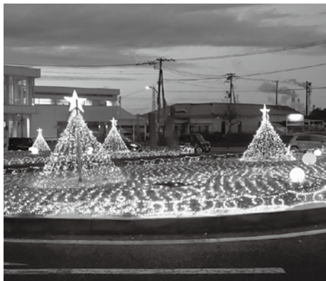
まちづくり協議会（イルミネーション）