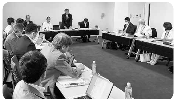
川西町での視察の様子

かわにし議会だよりの編集に当たっては、議会事務局の手助けを借りずに委員全員が担当した部分を責任もって編集を行っていました。委員の他に協力してくれるアドバイザー等が校正のアドバイスに携わっており、委員外の方々の協力についてももしっかりしているのが感じられました。13名の議員全員及びアドバイザー等の協力により、記事作成や取材、原稿作成依頼等、広報編集の作業体制がしっかりと組まれているのが感じられました。