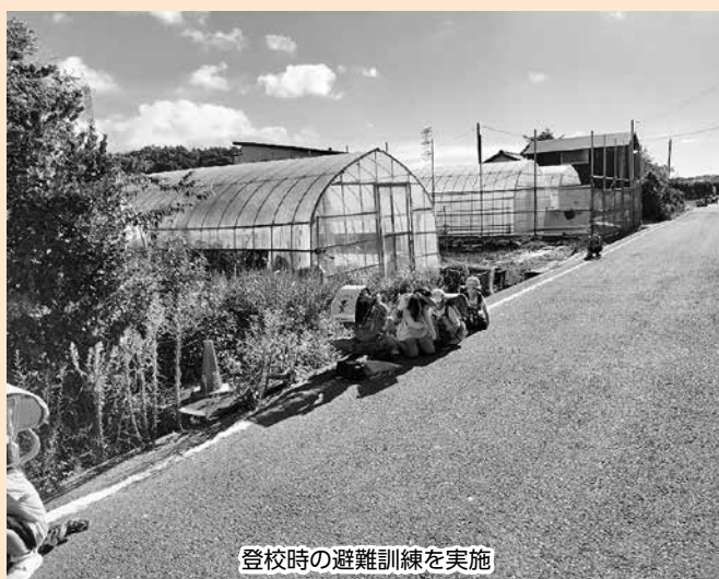
登校時の避難訓練を実施

今後も、袖ケ浦市議会として、若者の声を市政に反映させることができるよう取り組んでまいります。