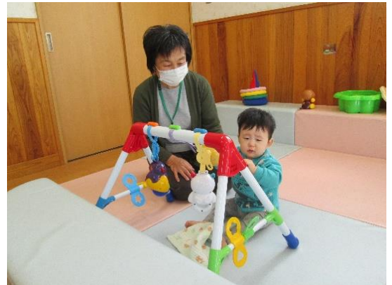
預かり援助の様子