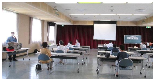
チャイルドシートの使い方の説明