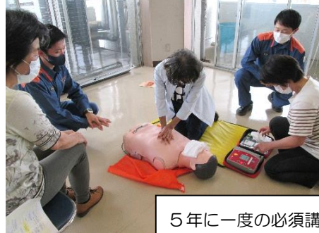
5年に一度の必須講習です。