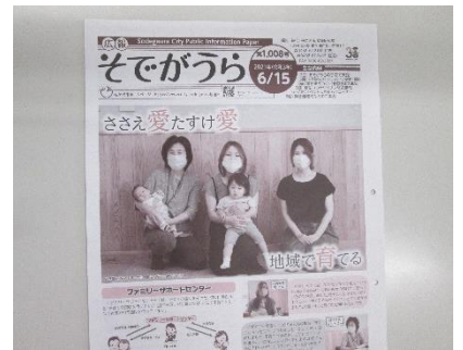
5人の写真が広報の表紙を飾りました