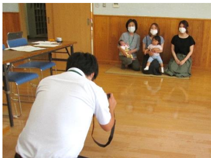
取材が終わり、みんなで写真撮影