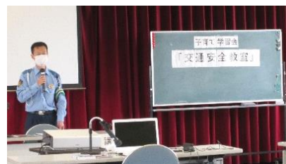
講師：木更津警察署 交通課職員