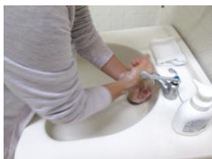
『手洗いの実習』 手洗いをした後に 特殊な機械で可視化