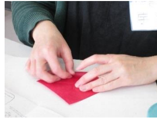
10 cm角の紙を折ります