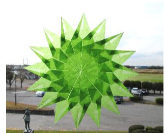
貼り合わせて出来上がり！