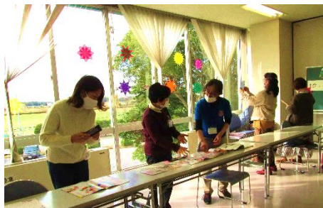
12/14(月) 第2回主催講座 「クリスマスの窓飾りを作ってみよう！」