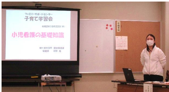
10/22(木) 第1回学習会「小児看護の基礎知識」

新年あけましておめでとうございます。本年もどうぞよろしくお願いいたします。 去年は毎日のように新型コロナウイルスのニュースを見る日々でした。今年はソーシャルディスタンスやマスクに悩まされることなく過ごせるよう祈るばかりです。早くのびのびと遊ぶ子どもたちの姿を見たいですね。 アドバイザーより