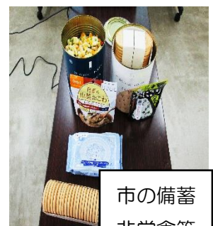
市の備蓄 非常食等

回答「市でも備蓄はしておりますが、粉ミルクや哺乳瓶を各ご家庭でも用意していただければと思います。加えて、ノンアルコールのウェットティッシュがあると良いと思います。大判の物ならば、おむつ替えだけでなく、身体を拭く等、幅広い用途で利用できます。